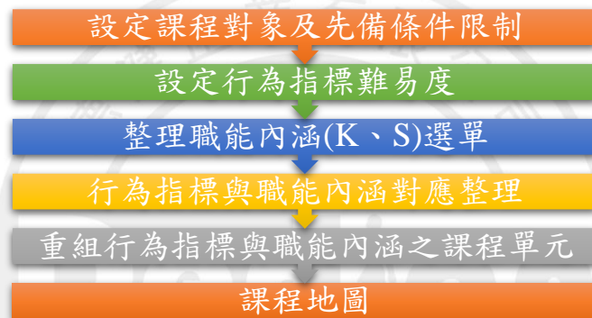
圖 2-1 課程地圖規劃流程图

依據本計畫自行發展「產品與機構工程師」職能模型中對應的職能內涵（知識 K、技能 S）及行為指標，考量其屬性、相關度與複雜度，組成單元課程。課程地圖規劃流程第一步為設定課程對象及修習前的先備條件限制，先行界定人員及課程條件基準；第二步依據行為指標所呈現出的難易度進行分類；第三步驟整理職能內涵的 K、S 選單；第四步驟為將整理好的行為指標與職能內涵 K、S 進行對應整理；第五步驟為開始將整理對應過的行為指標與職能內涵進行分類重組，最後產出課程地圖，課程地圖規劃流程如圖 2-1 所示。