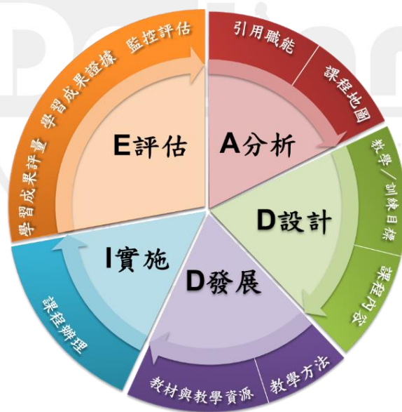
圖 1-1 ADDIE 教學設計模型

職能導向課程審核指標是掌握職能導向課程品質管理機制運作效能，對培訓產業的課程發展、建置、產出成果具有重要判準。經綜合國內外發展職能導向課程之經驗，結合職能導向課程特性，將諸多指標以 ADDIE 教學設計模型為主軸發展，如圖 1-1 ADDIE 教學設計模型所示。